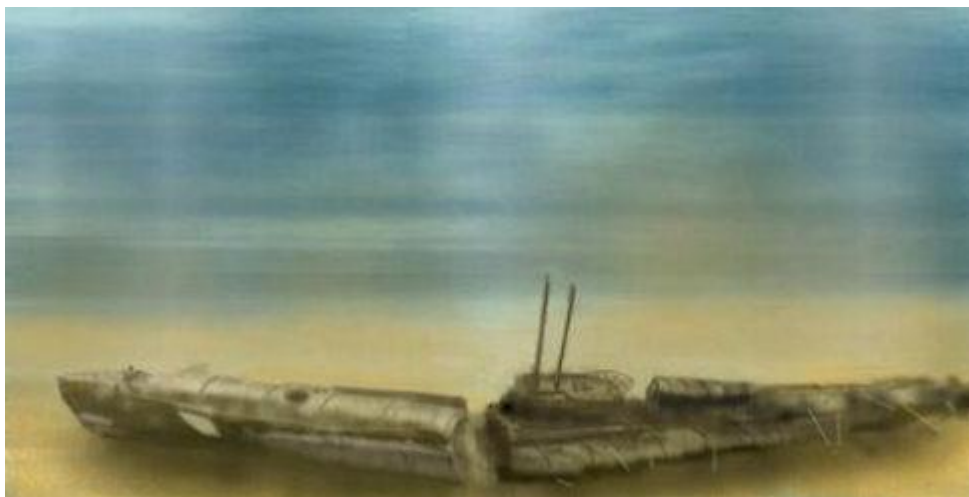
Come i palombari italiani trovano il relitto nel 1960

Nonostante tutto molti compartimenti stagni ressero e trentacinque sopravvissuti si raggrupparono per tentare di salvarsi attraverso boccaporto di poppa dopo aver allagato i locali macchine per stabilizzare ciò che restava dello scafo. Sebbene il battello fosse ferito a morte l'HMS Islay si accanì sul relitto e pochi istanti prima che il primo uomo potesse salvarsi lo Scirè fu finito e divenne la bara del suo equipaggio. Tutti i sessanta uomini (di cui undici della X Flottiglia MAS) morirono quel giorno ad Haifa e solo le salme di due degli incursori furono rinvenute sulle spiagge e seppellite con i massimi onori nel cimitero cristiano di Haifa. In questo modo agghiacciante si compì fine del Regio Smg. Scirè (e di innumerevoli altri battelli di ogni nazionalità) che giace tuttora in quel luogo di coordinate Nord 32° 54', 5 - Est 34° 58'.